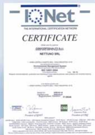
SISTEMA DI GESTIONE AMBIENTE CONFORME ALLA NORMA UNI EN ISO 14001:2004