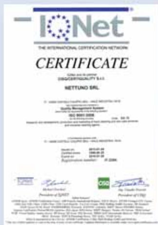
SISTEMA DI GESTIONE QUALITA' CONFORME ALLA NORMA UNI EN ISO 9001:2008

Desajamos aos nossos filhos um mundo mais limpo